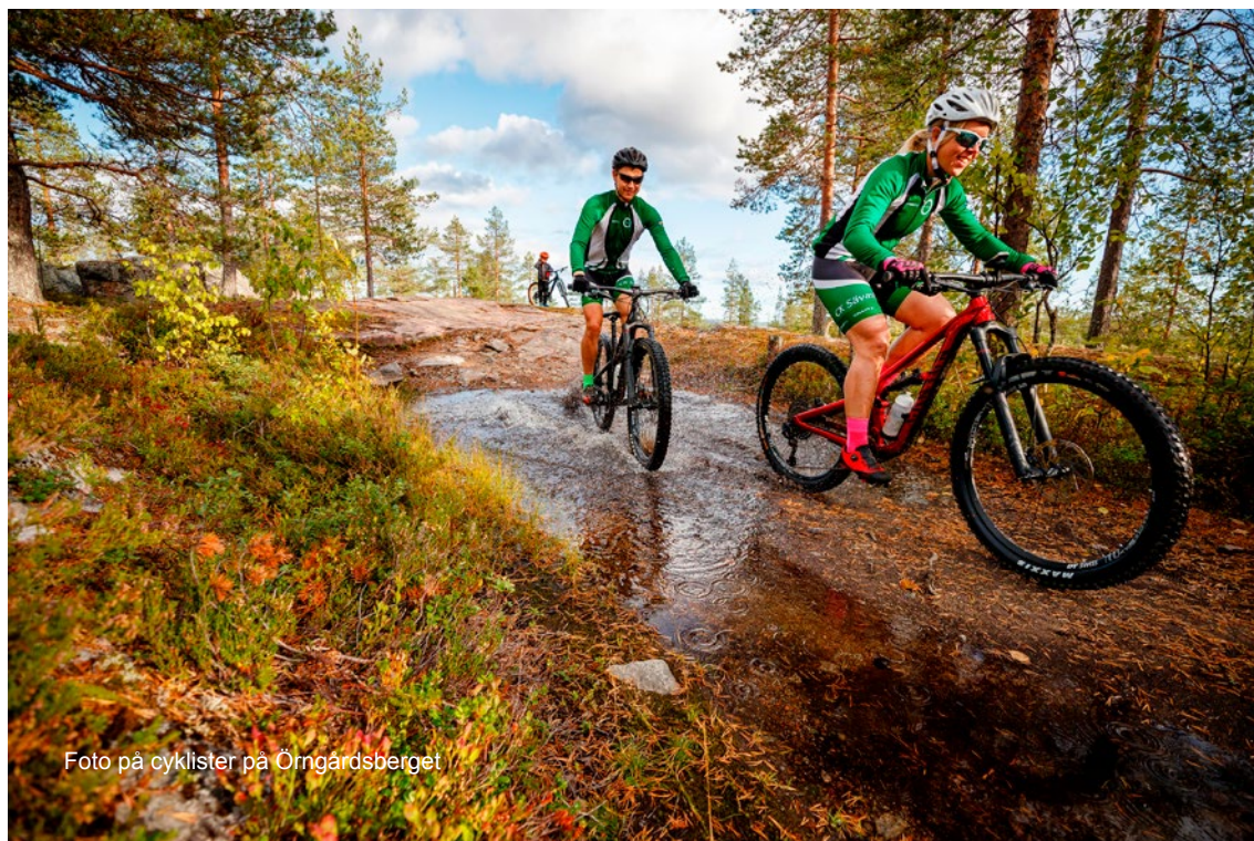
Foto på cyklister på Örngårdsberget

Gruvbeget ska vara tillgängligt att nå med skoter vintertid. Gruvberget nås via entréerna från söder och nordöst. Parkering och grillplats med vindskydd föreslås i slutet av förläggningen av skidbacken. Övriga parkeringsytor ska vara disponierade så det finns möjlighet att vända med skoter. På toppen vid Gruvbergsstugan ska möjlighet till elladdning av skoter finnas. Eventuella omdragningar av skoterleder kan komma att ske på grund av ny infrastruktur till Boden Industrial Park. Nära dialog med skoterföreningarna blir viktig.