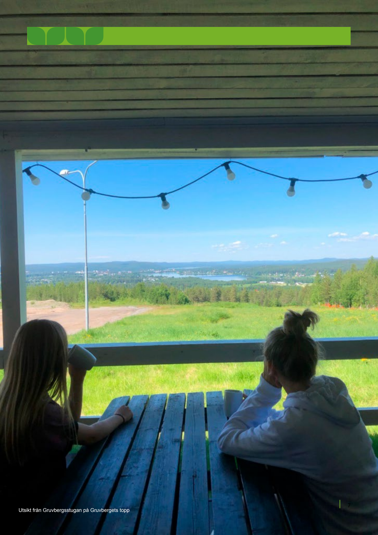
Utsikt från Gruvbergsstugan på Gruvbergets topp