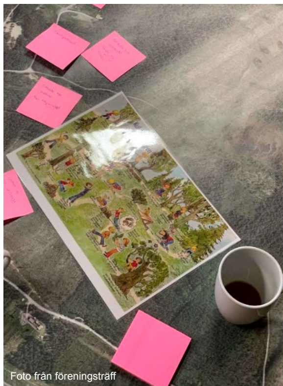
Foto från föreningsträff

Under hösten 2021 har det också funnits möjlighet för allmänheten att lämna sina tankar och idéer om Gruvbergets bevarande och utveckling genom en digital kartenkät. I kartverktyget fanns det möjlighet att peka ut platser där en vistas och använder samt platser som kan utvecklas. Totalt svarade cirka 170 personer på enkäten och tyckte till om cirka 540 platser på Gruvberget. Av de svarande var en majoritet i åldrarna 40- 64 år (54 procent). En stor andel har även varit i åldrarna 25- 39 år (27,5 procent). Störst andel av de svarande var kvinnor (cirka 60 procent).