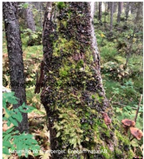
Fjälltaggsvamp på gränmark, D