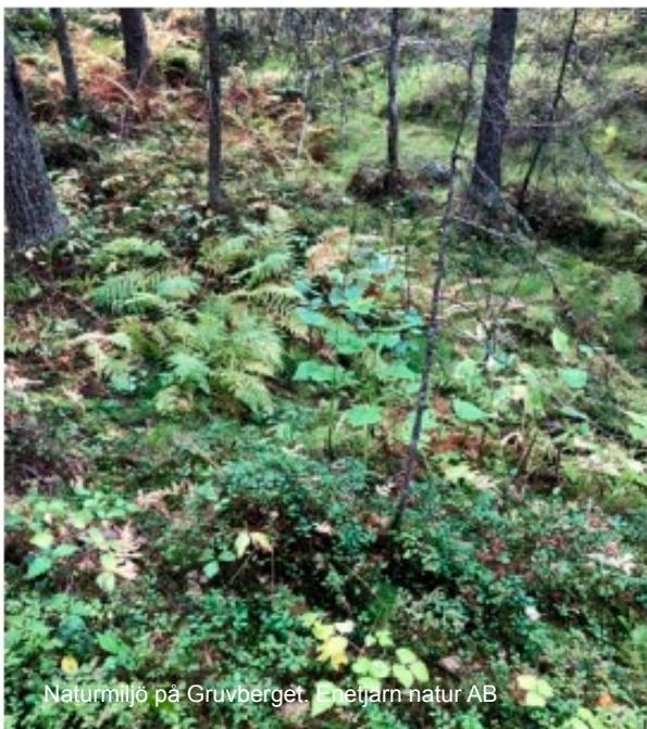
Naturmiljö på Gruvberget. Enefjärn natur AB