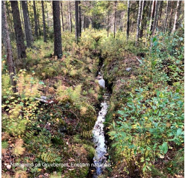
Naturmiljö på Gruvberget. Enefjärn natur AB

del finns ett flera kända och verifierade egistreringar av skyddsklassade arter som norna, guckusko och skogsfru. Kalkällan ska återställas genom att befintlig uppdämning tas bort. Utgångspunkten är att Gruvberget ska erbjuda spännande platser med information om naturmiljöer om exempelvis växter och naturgeografi. Ett spångsystem föreslås även i området vid kalkällan. Detta för att tillgängliggöra miljöerna för besökare men även för att försiktighet ska vidtas vid användning och rörelse i denna del av området.