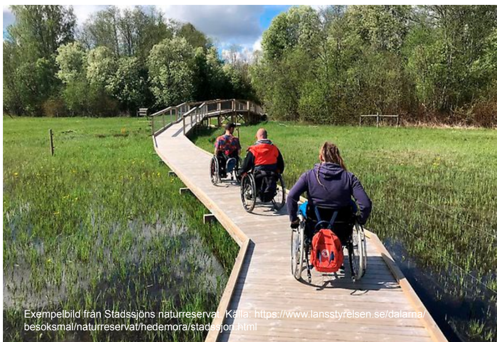
Exempelbild från Stadssjöns naturreservat.

Det ska vara möjligt att ta del av Gruvberget även om man inte har förmågan att gå eller att färdas långa sträckor utan att vila. För att möta behovet av tillgänglighet för personer med nedsatt funktionsförmåga är det viktigt att någon del av Gruvbergets område tillgängliggörs för människor med svårighet att ta sig fram i ojämn terräng, till exempel via tillgänglighetsanpassade spångar utrustade med vilplan och avåkningskydd där både rullstolar och barnvagnar kan ta sig fram. Spångarna behöver också utrustas med ett långsgående naturligt ledstråk för personer med synnedsättning samt taktila orienterings- och informationstavlor. Det ska finnas möjlighet för alla att sitta ned i en vacker och väderskyddad miljö. Intill det tillgänglighetsanpassade området bör ett antal nya parkeringsplatser för rörelsehindrade anläggas. Det tillgänglighetsanpassade spångssystem anläggs med fördel längs del av vandringsleden på Gruvbergets plåtå.